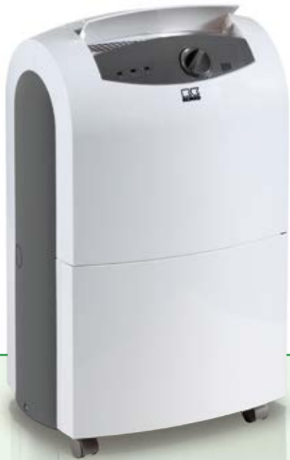
REMKO ETF 320