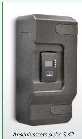
Anschlussets siehe S.42