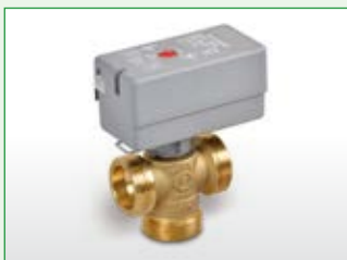
3-Wege Umschaltventil, 5/4"