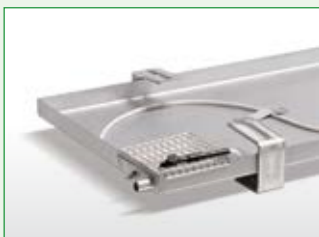
Kondensat-Auffangwanne für Außenmodul mit Ölabscheider