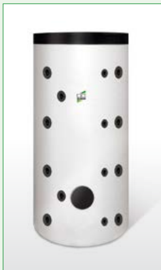
Pufferspeicher für Trinkwasser HPS 500 (500 l)