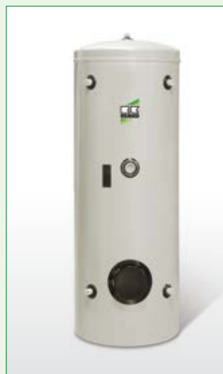
Pufferspeicher für Kühl- und Heizwasser KPS 300 (300 l)