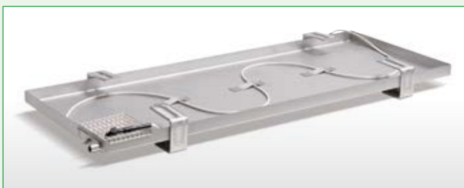
Kondensat-Auffangwanne für Außenmodul mit Ölabscheider